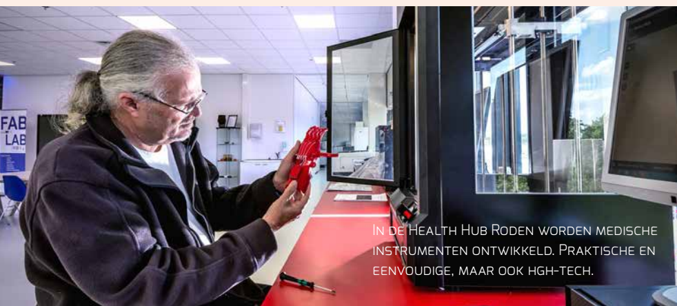
IN DE HEALTH HUB RODEN WORDEN MEDISCHE INSTRUMENTEN ONTWIKKELD. PRAKTISCHE EN EENVOUDIGE, MAAR OOK HGH-TECH.